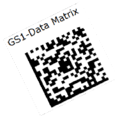
Etat des étiquettes 2 D - octobre 2016